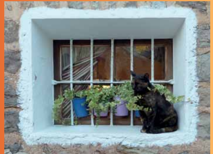
BILD: dekoratives Fenster gesehen auf Mallorca