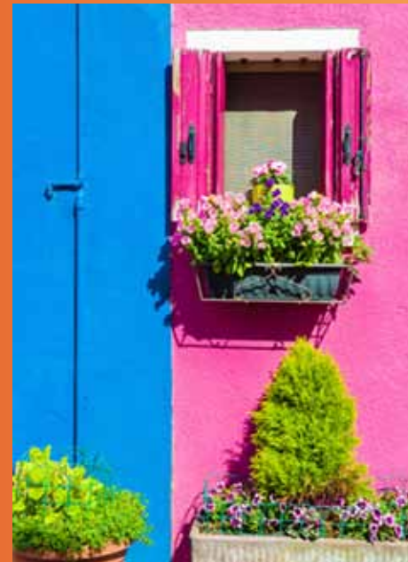
BILD: Fenster auf Burano bei Venedig