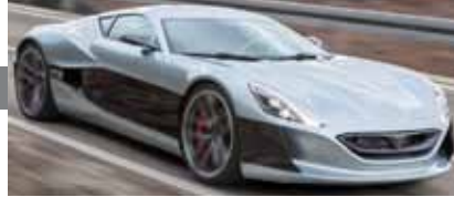
Das schnellste Elektroauto der Welt kommt aus Kroatien: ‘Concept One’ von Rima

Laut IAB (Institut für Arbeitsmarkt- und Berufsforschung) können ca. 20% der 40 Mio. Arbeitsplätze in den nächsten 30 Jahren durch Computer/ Maschinen ersetzt werden. Dies betrifft v.a. Fertigungsberufe und - ganz erstaunlich: ungelernete Helfer sind nicht zu ersetzen, Fachkräfte zum Teil schon. So sind v.a. kognitive und manuelle Routineaufgaben gefährdet. Berufe, die soziale Intelligenz und soziale Interaktion oder Kreativität erfordern sind schwer zu digitalisieren. Auch nicht Wahrnehmung und Feinmotorik, Management, Beratung und Vertrieb. Ganz wichtig: Weiterbildung wird auch für Fachkräfte immer wichtiger, besonders im digitalen Bereich. Der Dienstleistungsbereich wird auch weiterhin stark wachsen.