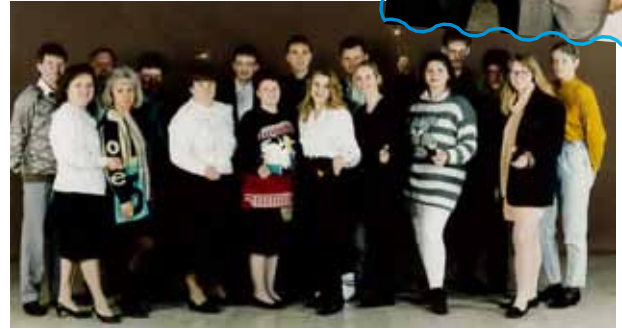
das RAHMER-Team von 1996

Solche Prognosen sind schwer zu machen, aber ich denke, dass wir uns allen neuen Herausforderungen stellen. Solange der Kunde im Mittelpunkt unseres Schaffens steht, wird RAHMER sich weiterhin positiv entwickeln. Und wir sind offen für Neues. Wir freuen uns über immer effizientere Arbeitsgeräte und umweltschonende Techniken und sehen die Digitalisierung als Chance.